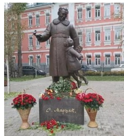
Первый в мире памятник Маршаку открыли в Воронеже